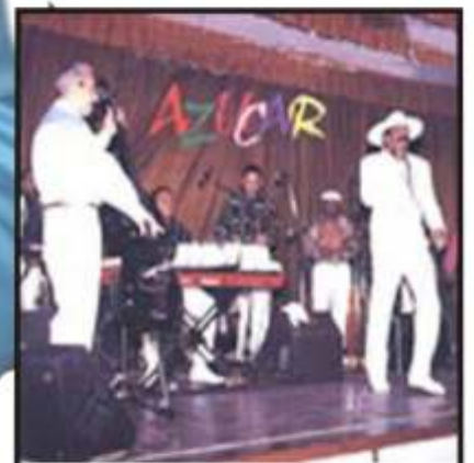
Los Van Van, una orquesta con saboooooor” y asuquittaa” Y esto no es todo, hay algo que no estça en el reportaje, y lo publicaremos en primicia....