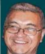
Foto retocada (bordes acentuados) para lograr mejor nitidez.