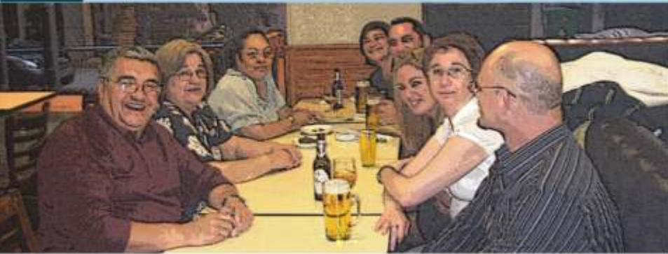
Abundante cerveza, y abundantes sonrisas, para un primer encuentro cargado de expectativas. Cuando esto se repita, por lo menos, que sea igual...