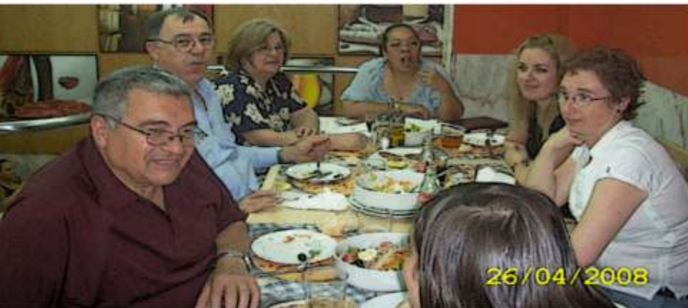
Ya en uno de los tantos rincones de tapas dando cuenta de jamón, tortillas, calamares, croquetas etc. sin dejar de hablar de poesía.